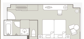
Superior Twin C