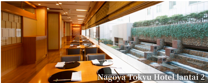
Nagoya Tokyu Hotel lantai 2

Didirikan pada tahun 1830, Nadaman adalah restoran Jepang legendaris yang telah melestarikan tradisi kuliner Jepang selama lebih dari 190 tahun. Menghadirkan kelezatan setiap musim, Nadaman memadukan bahan-bahan segar pilihan, teknik kuliner yang halus, dan penyajian artistik untuk menciptakan hidangan yang memikat semua indra. Sebagai ryotei (restoran tradisional Jepang) ternama, Nadaman telah menjamu berbagai tamu kenegaraan dan tamu istimewa dari seluruh dunia. Kini, Nadaman menghadirkan pengalaman kuliner yang tak terlupakan dalam suasana yang elegan dan penuh kehangatan, disesuaikan dengan selera dan kenyamanan masa kini. Tradisi, keanggunan, dan cita rasa, semua berpadu di Nadaman.